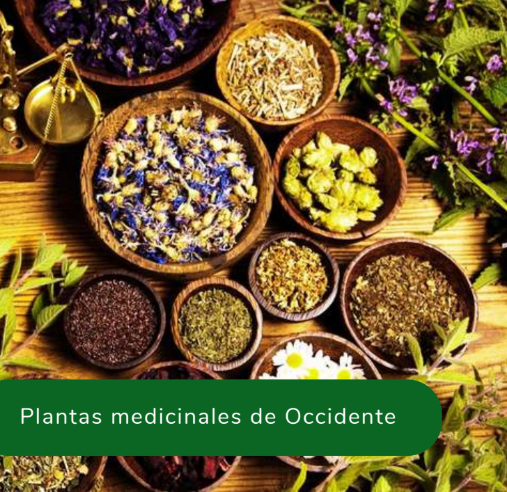
Plantas medicinales de Occidente

Si la quieres cursar antes del 3º Año deberás inscribirte en la Diplomatura de Herboristería y cumplir los requisitos de su aprobación.