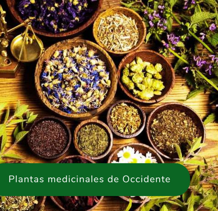
Plantas medicinales de Occidente

Si la quieres cursar antes del 3° Año deberás inscribirte en la Diplomatura de Herboristería y cumplir los requisitos de su aprobación.